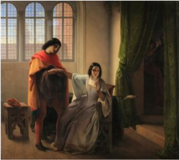
Hayez Imelda de' Lambertazzi, olio su tela 122 x 126 cm

La nuova bella esposizione autunnale ideata e prodotta da Comune di Novara, Fondazione Castello e Mets Percorsi d'Arte con il patrocinio di Regione Piemonte, Commissione Europea, Provincia di Novara, Comune di Milano, Main Sponsor Banco BPM, intende illustrare, attraverso circa ottanta capolavori eseguiti dai maggiori protagonisti della cultura figurativa ottocentesca attivi a Milano, i mutamenti susseguitesesi nel capoluogo lombardo tra gli anni dieci e i primi anni ottanta dell'Ottocento. Decenni turbolenti nei quali Milano ha visto la caduta del Regno napoleonico d'Italia, la costituzione del Regno Lombardo Veneto e la seconda dominazione austriaca, le prime rivolte popolari e le guerre d'indipendenza che nel 1859 avrebbero portato alla liberazione. Il percorso espositivo, concepito dalla curatrice Elisabetta Chiodini coadiuvata da un Comitato scientifico di cui fanno parte Niccolò D'Agati, Fernando Mazzocca, Sergio Reborà, è articolato in otto sezioni che seguono l'andamento delle sale del Castello Visconteo Sforzesco e ripercorre l'evoluzione della pittura lombarda dal Romanticismo alla Scapigliatura, fenomeno culturale nato a Milano negli anni sessanta dell'Ottocento che coinvolgeva poeti, letterati, musicisti, artisti, uniti da una profonda insofferenza nei confronti delle convenzioni della società e della cultura borghese. Un affascinante viaggio nella Milano