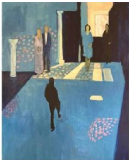
People welcome black man - 2021 Acrilico su tela - cm 100x80

Alla 49 a edizione della rassegna internazionale d'arte Premio Sulmona l'artista chierese Pier Tancredi De-Coll' ha ottenuto dalla giuria presieduta da Vittorio Sgarbi e Raffaele Giannantonio una menzione d'onore per l'opera "People welcome black man."