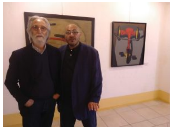
L'artista con Vittorio Alfieri