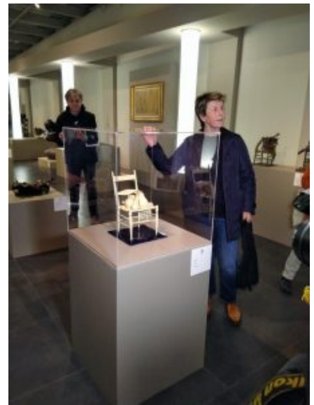
Giulia Manzù in mostra

La Città di Vercelli ospita dal 10 marzo al 21 maggio una grande mostra retrospettiva delle opere di Giacomo Manzù dal titolo "La scultura è un raggio