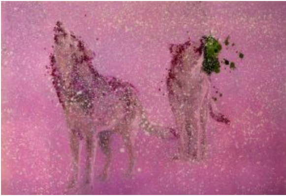
tomaino - CANTO - ALLA - LUNA - cm180x280 - ossidi - e - polpa - di - cellulosa - su - tela - 2011

Il 7 aprile 2023 le porte di palazzo Lomellini si apriranno per invitare il pubblico a un nuovo appuntamento all'insegna dell'arte. La mostra, intitolata Homines et Lupi , a cura di Riccardo Cordero, si articola in un gran numero di opere presentate da due artisti affermati come Santo Tomaino e Francesco Preverino.