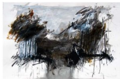
Il limitare del bosco (2022)