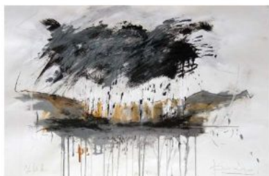
Le betulle (2022)