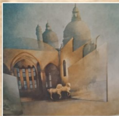
L'ULTIMA RECITA DI VENEZIA di Giorgio Simonaio