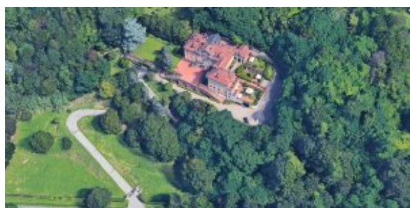
villa Martini di Cigala