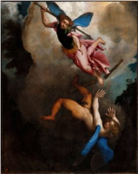
Lorenzo Lotto. San Michele Arcangelo caccia Lucifero, 1545

Lorenzo Lotto, San Michele arcangelo caccia Lucifero, 1545 ca., Olio su tela, 167 x 135 cm, Museo Pontificio Santa Casa, Loreto