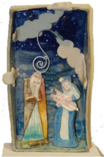
"Presepe tra le Nuvole" di Massimo Voghera

MOMBERCELLI MUSEO CIVICO D'ARTE MODERNA E CONTEMPORANEA Via Brofferio, 24 (vicino caserma Carabinieri) dal 2 dicembre 2023 al 28 gennaio 2024