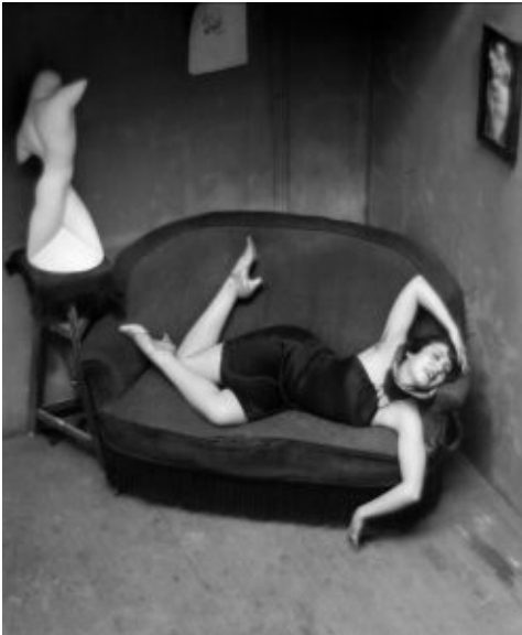
A. Kertész, Danzatrice satirica, 1926

André Kertész, Henri Cartier-Bresson, Brassai, Robert Doisneau