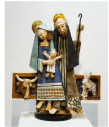
"Presepe" di Guglielmo Marthyn