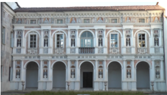
palazzo muratori cravetta

Il Comune di Savigliano e Oasi Giovani Ets organizzano – in collaborazione con il Museo Civico Gipsoteca di Savigliano – un evento espositivo nella splendida cornice di Palazzo Muratori-Cravetta dedicato al compianto professor Francesco