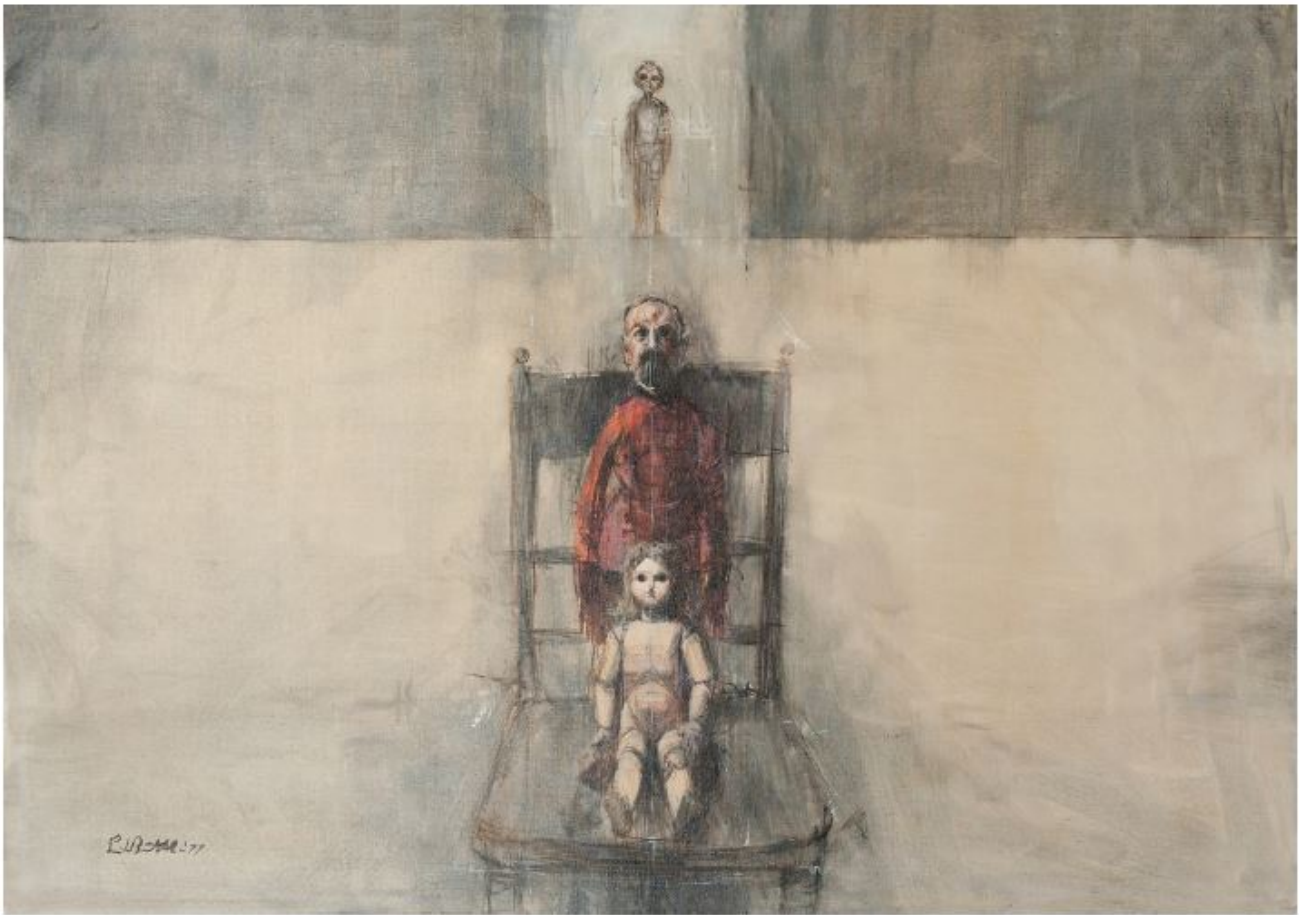
Bambole e burattini, 1977 - acrilico su tela cm 70x100

Alle ore 16.00 inaugurerà la mostra Memoria intima di Guido Bertello allestita presso l'antica chiesa romanica di San Rocco in via Cesare Battisti a Condove (TO) e sarà visitabile fino al 12 maggio 2024, organizzata dagli Amici della Chiesa di San Rocco e l'Associazione Culturale "ELEVAl - Momenti d'Arte" in collaborazione con la Galleria Losano Associazione Arte e Cultura di Pinerolo (TO) e la famiglia Bertello. In questa mostra che vuole ricordare Guido Bertello nei trent'anni dalla sua scomparsa, verranno presentate una ventina di opere storiche, tra quelle ritenute maggiormente rappresentative della sua "memoria intima", immagini interiori e frammenti di un mondo scomparso, rimaste inamovibili nel suo inconscio, dipinte tra il 1970 e il 1982.