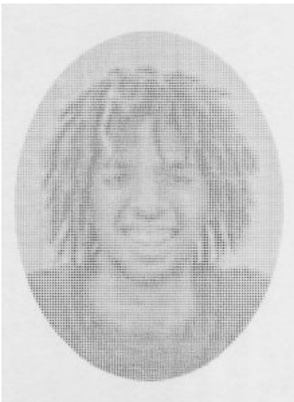
James Scott Brooks, Portraits

4 maggio 2024 dalle ore 19.00 alle ore 23.00