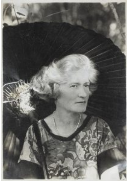
figure della moda nel periodo fra le due guerre.

Questi materiali vengono impiegati per creare paesaggi, nature morte e scene di vita quotidiana, offrendo una nuova interpretazione del fare pittura. Le sue opere sembrano quasi acquerelli, vividi e trasparenti, grazie alla naturalezza del “tremolio di un pennello leggero”, definizione coniata da Jean Cassou nel 1936.