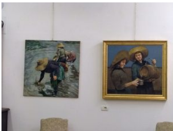
Le mondine, dipinti di Andreotti

Lo scorso sabato 11 maggio '24 è stata inaugurata a Ghemme, presso gli spazi (ora espositivi) dell'antica Trattoria Massetta di via Novara 75/77, una personale di Luca Andreotti.