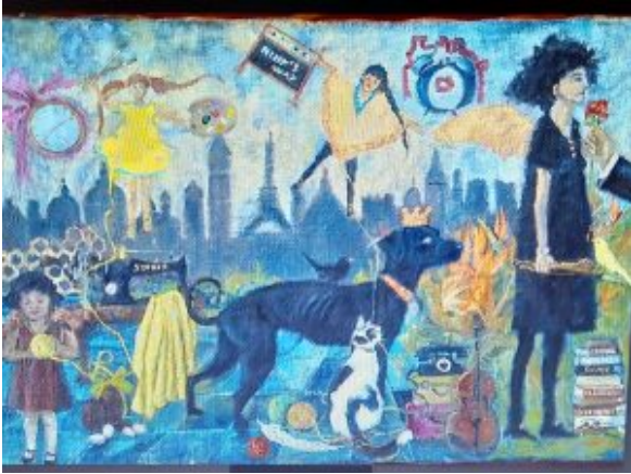
Dipinto di Daniela Bigott

Dal 18 al 26 maggio '24 l'associazione culturale “Artenova” di Novara allestisce, presso il suo spazio espositivo di vicolo della Canonica 3b, la mostra collettiva “La Scatola dei Sogni”, con i seguenti orari di visita: venerdì, sabato e domenica dalle 15,30 alle 18,30. L'inaugurazione avverrà sabato 18 maggio, alle ore 16,00, con relatrice Emanuela Fortuna.