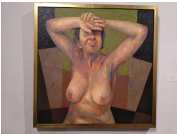
Dopo il risveglio, dipinto di Andreotti

Chiude la mostra una grande quadro dedicato alle "Mondine" (nella foto), realizzato a tasselli (quadratinini), una sua recente tecnica che ci ricorda i principi del Divisionismo, così come avviene, con particolari pennellate a sovrapposizione cromatica, per il nudo femminile "Dopo il risveglio" (2024), che vediamo in foto.