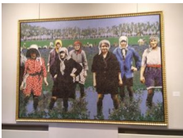
Le mondine, dipinto di Andreotti

Lo scorso sabato 19 ottobre è stata inaugurata a Novara, alla presenza di un folto pubblico, presso la Sala dell'Accademia del complesso del Broletto di Novara, l'interessante mostra "Il Teatro della Vita" di Luca Andreotti, a cura di Lorella Giudici, che ne ha anche curato il ricco catalogo (oltre a presentare la mostra attuale, ricostruisce con un esaustivo testo e numerose foto l'intera produzione dell'artista, attraverso una serie di capitoli: "Casette, tricicli e macchinine: "Quando il gioco è un sogno... irraggiungibile", "Nature morte: una sfilata di oggetti... fuori posto", "Macellazioni... futuriste", "Un gineceo... in isolamento", "Mondine, balilla e garzoni. Il mondo di ieri... a quadretti" e infine una nota biografica e l'elenco delle mostre