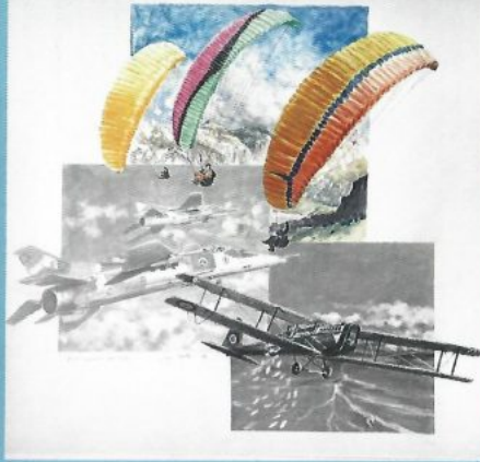
"Breve racconto del volo" - tecnica mista, 50x50 cm

In certe occasioni Cestari scompone e ricompone immagini e situazioni con tasselli luminosi e creativi che evidenziano particolari rappresentativi.