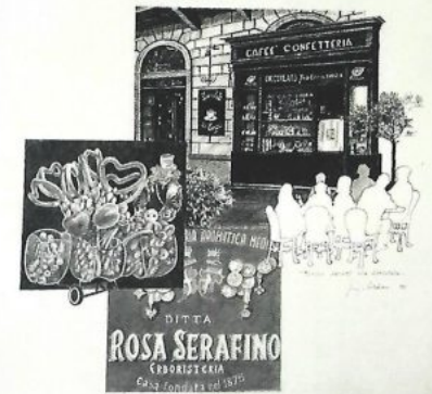
"Torino davanti alla Consolata" - tecnica mista, 50x55 cm