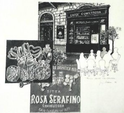
"Torino davanti alla Consolata" - tecnica mista, 50x55 cm