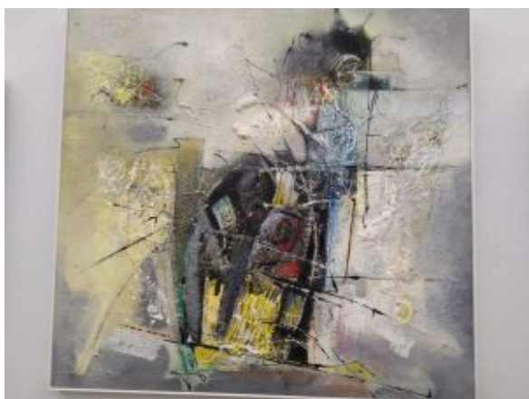
Opera di Domenico Minniti

La rassegna, che continuerà fino al 19 novembre (h. 10-19, chiuso sabato, domenica e festivi) propone una prima parte delle opere precedentemente esposte (dall’8 al 14 settembre 2024) presso la Sala della Gran Guardia di Portoferraio nell’isola d’Elba, mentre i lavori degli artisti dell’isola saranno oggetto di una prossima mostra.