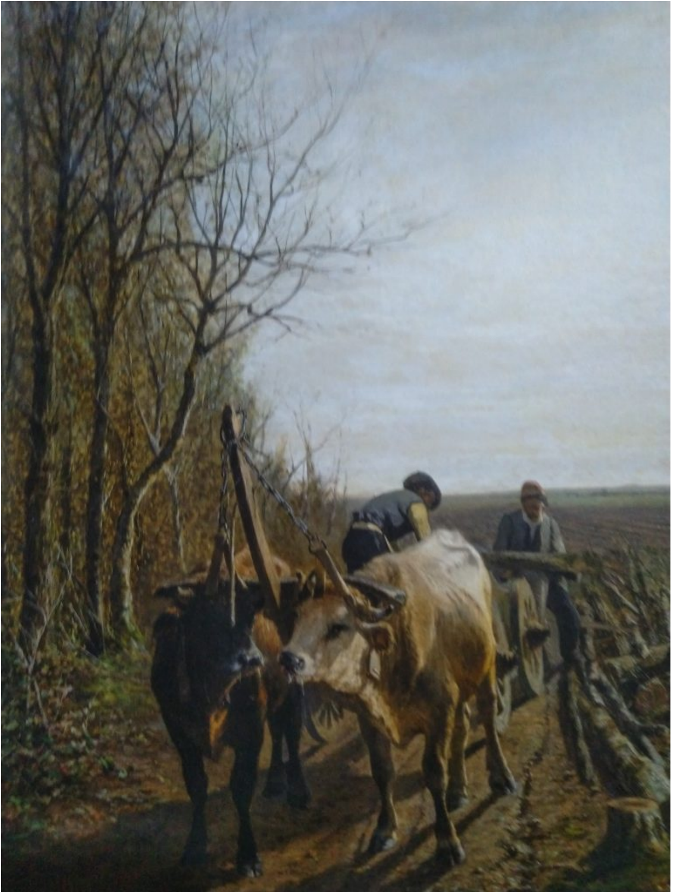
Le imposte anticipate, dipinto di Pittara

valorizzata quanto merita, ma decisamente importante per la storia dell'arte dell'Italia e dell'Europa, i cui protagonisti