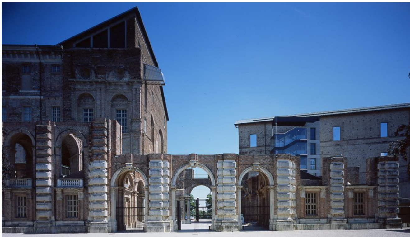
castello di Rivoli