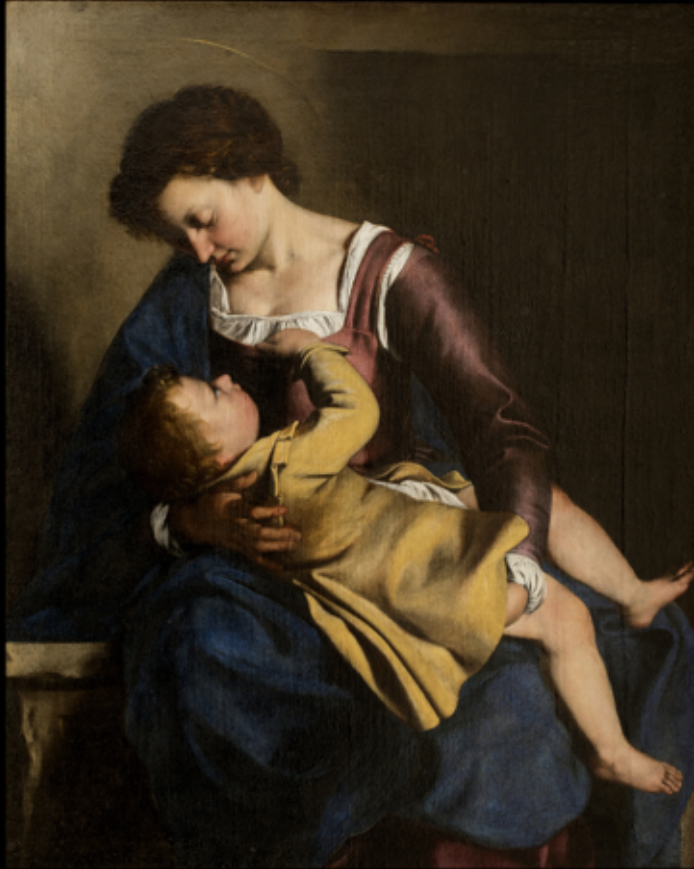
Orazio Gentileschi (Pisa, 1563 – Londra, 1639) Madonna col Bambino 1610 circa

Roma, Gallerie Nazionali di Arte Antica, Galleria Corsini