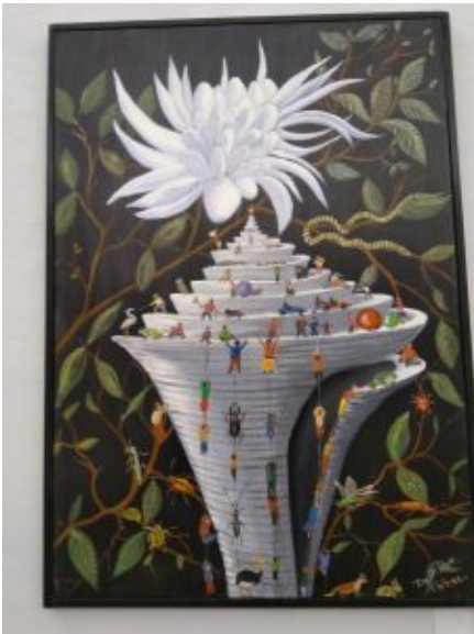
Torre di Babele di Pierre Demoor

L'iniziativa è la seconda della nuova stagione espositiva proposta nella sede di Azimut. Nell'area esterna di Azimut è collocata una imponente scultura di Salvatore Fiore, che rappresenta un po' l'emblema delle future iniziative.