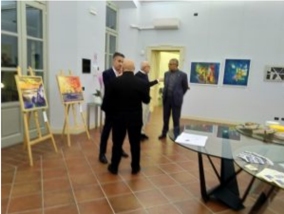
Sala della mostra

Lo scorso venerdì 22 novembre 2024 è stata inaugurata a Novara, presso Azimut Novara (via Canobio 7) la rassegna “I colori di un’isola”, mostra organizzata dal “Circolo degli artisti isola d’Elba” e dalla Città di Novara del progetto Il Gusto dell’Arte di Art Exhibition, a cura di Vincenzo Scardigno, a seguire è avvenuta la presentazione del romanzo “Sfatti” della scrittrice Natascia Sgarbossa (nella foto un’opera esposta e una delle sale durante l’inaugurazione).